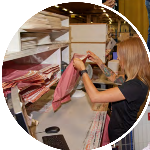
Sista ordern i Falkenberg packas.